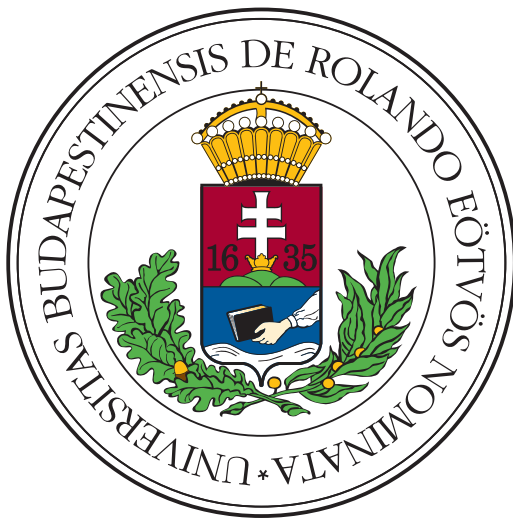
(a) Vestibulum quis mattis urna

In non ipsum fermentum urna feugiat rutrum a at odio. Pellentesque habitant morbi tristique senectus et netus et malesuada fames ac turpis egestas. Nulla tincidunt mattis nisl id suscipit. Sed bibendum ac felis sed volutpat. Nam pharetra nisi nec facilisis faucibus. Aenean tristique nec libero non commodo. Nulla egestas laoreet tempus. Nunc eu aliquet nulla, quis vehicula dui. Proin ac risus sodales, gravida nisi vitae, efficitur neque, Figure 2.3: