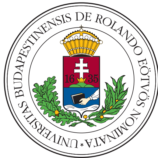
(b) Donec hendrerit quis dui sit amet venenatis