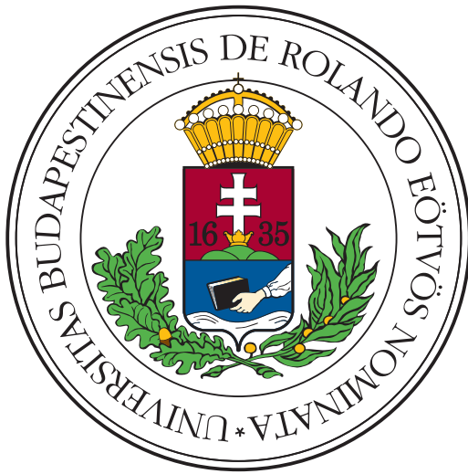
(a) Vestibulum quis mattis urna

In non ipsum fermentum urna feugiat rutrum a at odio. Pellentesque habitant morbi tristique senectus et netus et malesuada fames ac turpis egestas. Nulla tincidunt mattis nisl id suscipit. Sed bibendum ac felis sed volutpat. Nam pharetra nisi nec facilisis faucibus. Aenean tristique nec libero non commodo. Nulla egestas laoreet tempus. Nunc eu aliquet nulla, quis vehicula dui. Proin ac risus sodales, gravida nisi vitae, efficitur neque, Figure 2.3: