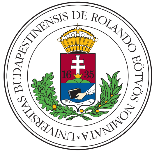
(b) Donec hendrerit quis dui sit amet venenatis