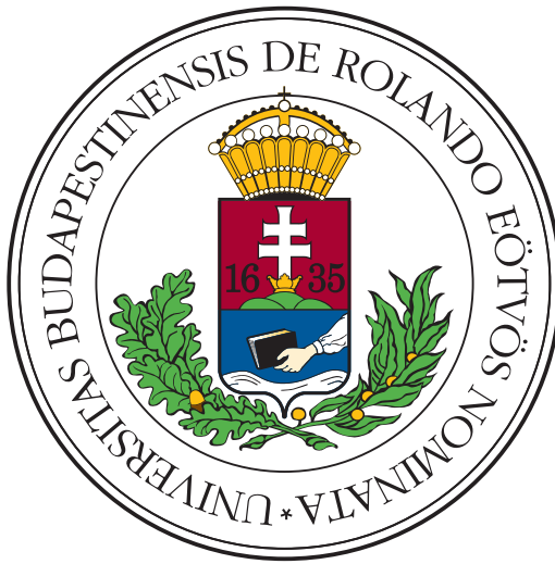
(a) Vestibulum quis mattis urna

In non ipsum fermentum urna feugiat rutrum a at odio. Pellentesque habitant morbi tristique senectus et netus et malesuada fames ac turpis egestas. Nulla tincidunt mattis nisl id suscipit. Sed bibendum ac felis sed volutpat. Nam pharetra nisi nec facilisis faucibus. Aenean tristique nec libero non commodo. Nulla egestas laoreet tempus. Nunc eu aliquet nulla, quis vehicula dui. Proin ac risus sodales, gravida nisi vitae, efficitur neque, 2.3. ábra: