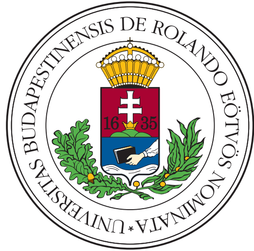
(b) Donec hendrerit quis dui sit amet venenatis