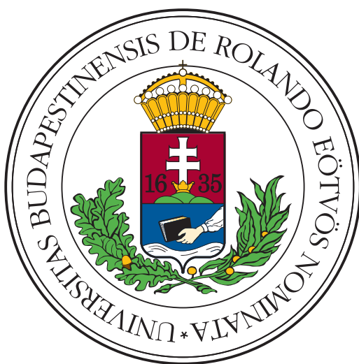
(a) Vestibulum quis mattis urna

In non ipsum fermentum urna feugiat rutrum a at odio. Pellentesque habitant morbi tristique senectus et netus et malesuada fames ac turpis egestas. Nulla tincidunt mattis nisl id suscipit. Sed bibendum ac felis sed volutpat. Nam pharetra nisi nec facilisis faucibus. Aenean tristique nec libero non commodo. Nulla egestas laoreet tempus. Nunc eu aliquet nulla, quis vehicula dui. Proin ac risus sodales, gravida nisi vitae, efficitur neque, Figure 2.3: