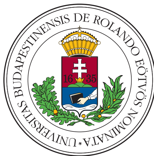
(b) Donec hendrerit quis dui sit amet venenatis